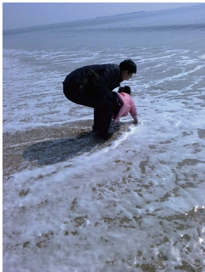
让女儿心中 盛满大海的温暖和浪花快乐