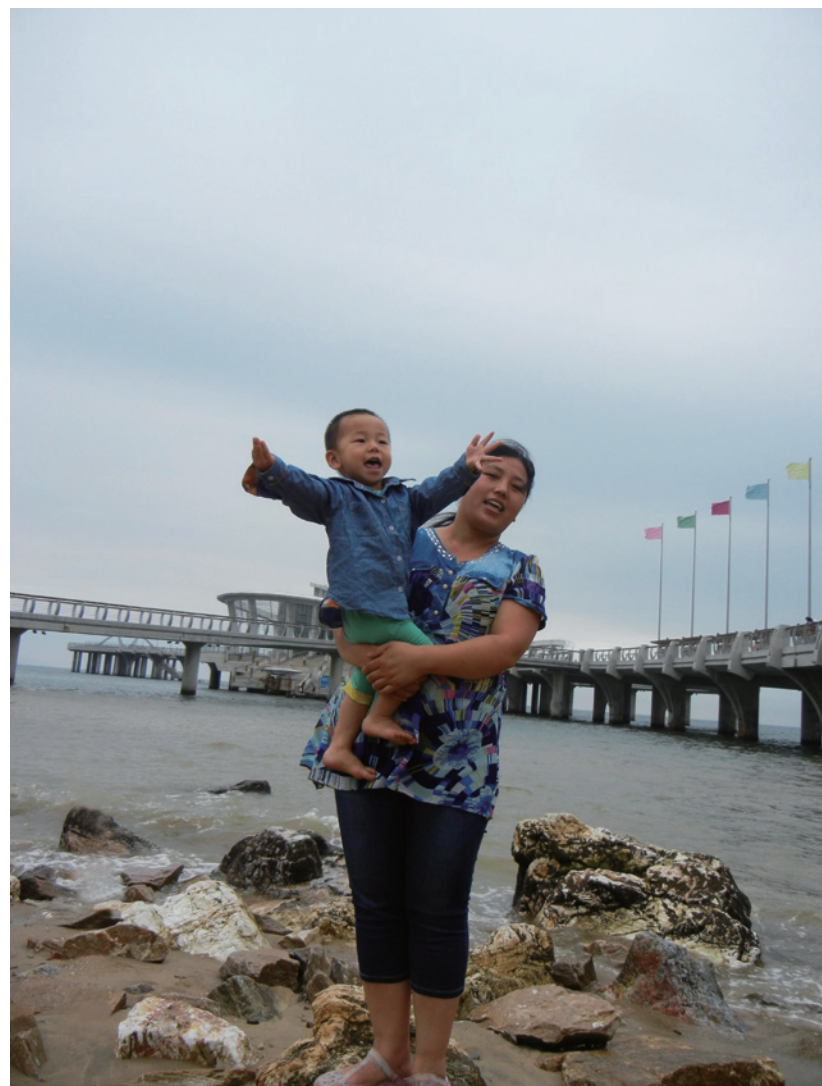
妈妈——/大海——/ 瞬间 纯真弥漫了胸怀 爱弥漫了天地