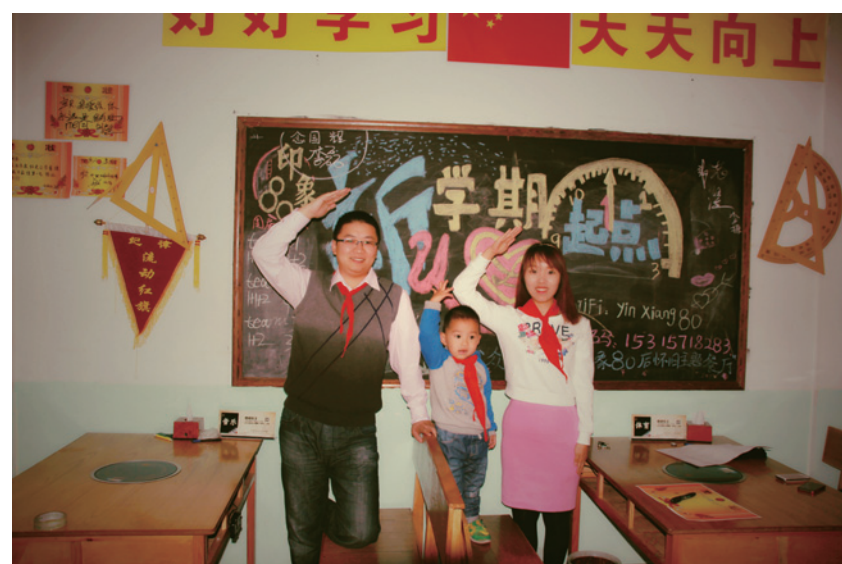
一齐敬礼 一起成长 呵护同一个梦想