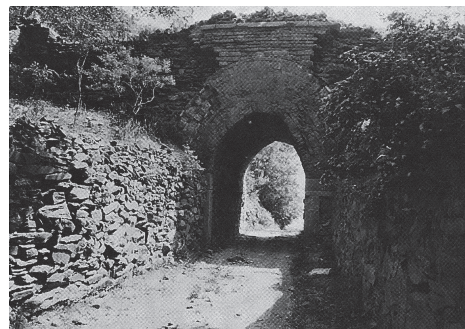
古关口 湮没了古道 荒芜了边城 岁月啊 你带不走那一串串熟悉的姓名